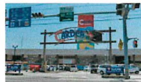
■サンシャインカルディア店950m